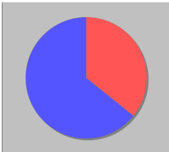
Distribuzione dei docenti per tipologia di contratto

● Docenti non di ruolo - 68 ● Docenti di Ruolo Titolarita' sulla scuola - 122