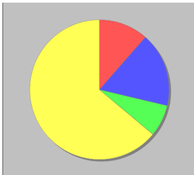
Docenti a T.I. per anzianità di ruolo

● Fino a 1 anno - 14 ● Da 2 a 3 anni - 21 ● Da 4 a 5 anni - 9 ● Piu' di 5 anni - 78